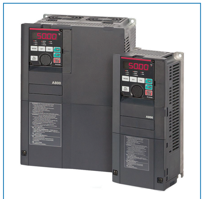
Рисунок 1. Частотный преобразователь.

Другим немаловажным фактором в пользу использования ЧП является сведение к минимуму гидравлических ударов в трубопроводах при включениях и отключениях насосов, т.е. фактически к минимуму сводится вероятность порывов трубопроводов с теплоносителем. Таким образом, применение ЧП для управления насосным агрегатом позволяет не только поддерживать необходимое давление или расход (что обеспечивает экономию электроэнергии), но и продлить срок службы трубопроводов и снизить потери транспортируемого теплоносителя.