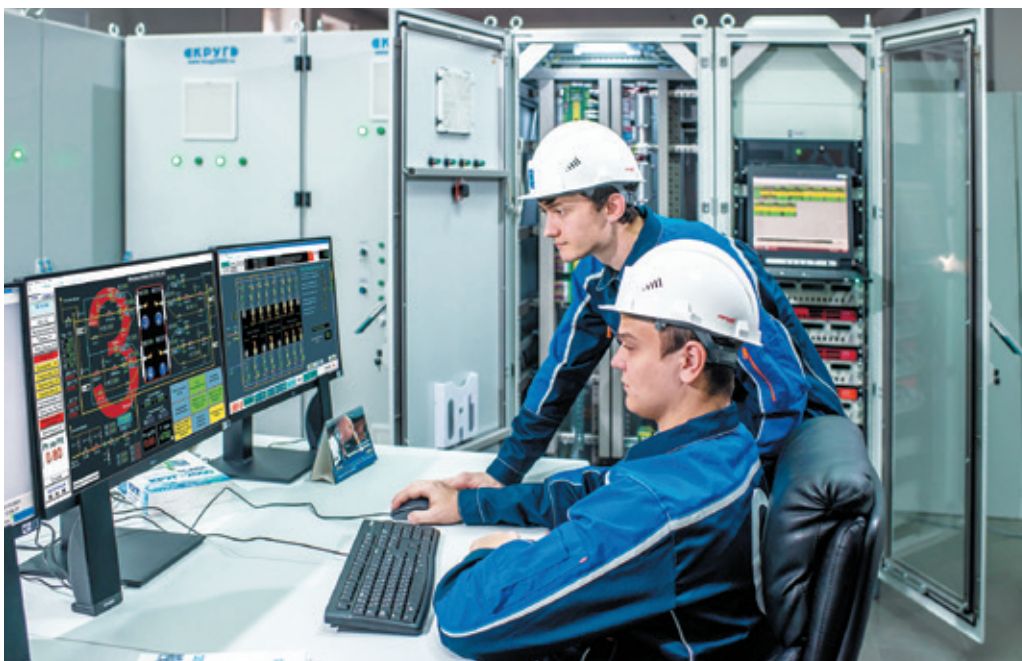
Рис. 2. Тестирование ПАК ПТК КРУГ-2000 на полигоне НПФ "КРУГ"

к производственным объектам I-III классов опасности. Кроме того, компанией "КРУГ" разрабатываются и используются программные и технические средства российского производства, что в настоящее время наиболее актуально, когда вектор государственных стандартов направлен на разработку и поддержку собственных программных продуктов, адаптированных под требования действующих российских нормативно-правовых актов, позволяющих в короткие сроки добиться положительного результата и создавать индивидуальные проектные решения с последующим обучением специалистов подрядных организаций и самого заказчика работе с данной системой (рис. 2).