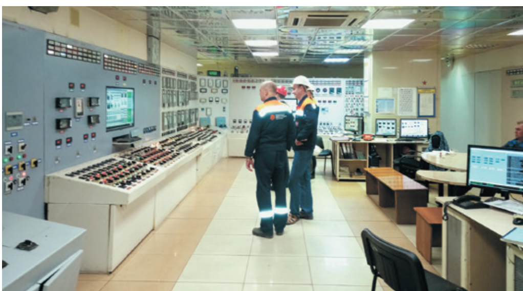
Рис. 3. Уфимская ТЭЦ-4

Программные продукты НПФ "КРУГ" SCADA-система КРУГ-2000® и Система Реального Времени Контроллера (СРВК) являются полностью российской разработкой, что исключает влияние геополитической обстановки на эксплуатацию и техническое обслуживание автоматизированных систем. Российское происхождение ПАК ПТК КРУГ-2000 позволяет контролировать стоимость конечного продукта и закладывать его в долгосрочные проекты. За последние 2 года удалось оснастить системами автоматизации более двух десятков энергоустановок на тепловых электростанциях БГК. Среди них: Уфимские ТЭЦ-1, ТЭЦ-2, ТЭЦ-3 и ТЭЦ-4 (рис. 3), При-