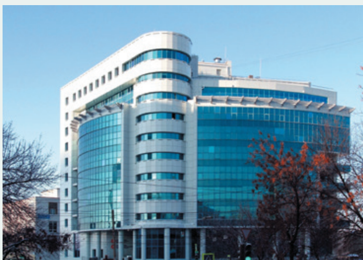
▲ Рис. 1. Главное офисное здание БГК в Уфе

Башкирская генерирующая компания – одна из крупнейших региональных энергетических компаний России, владеет значительной базой активов: одной ГРЭС, одиннадцатью ТЭЦ и ТЭС, двумя крупными ГЭС, а также объектами малой энергетики. Установленная электрическая мощность энергообъектов компании – 4415 МВт. На их долю приходится около 90 % электроэнергии, вырабатываемой в республике Башкортостан. Тепловая мощность башкирской генерации – 8648 Гкал/час. Она обеспечивает тепловой энергией промышленность и жилые кварталы крупных городов региона. С 2012 года компания входит в группу “Интер РАО” (рис. 1).