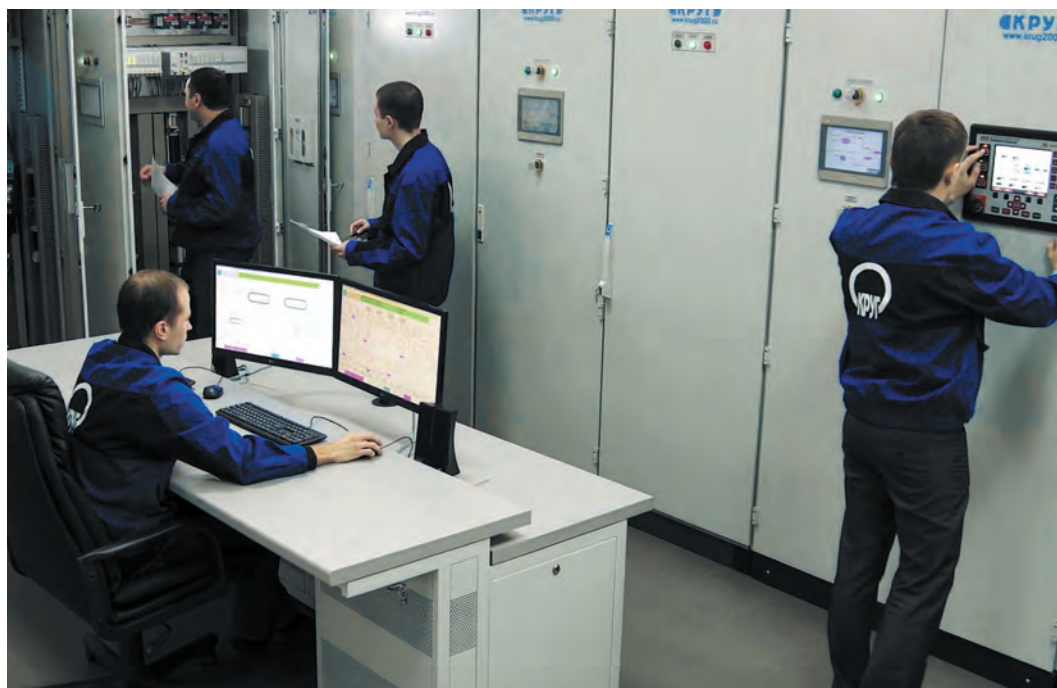
РИС. 2. ▼ ПТК КРУГ-2000

Приведу краткий список объектов энергетики, где функционируют АСУ ТП и системы учета энергоресурсов на базе ПАК/ПТК КРУГ-2000. В «Интер РАО» это Печорская ГРЭС и предприятия Башкирской генерирующей компании. Для компании «Т Плюс» автоматизированы ТЭЦ в Самаре, Тольятти, Новокуйбышевске, Нижнем Новгороде, Чебоксарах, Саранске, Пензе, Ульяновске. Внедрения есть