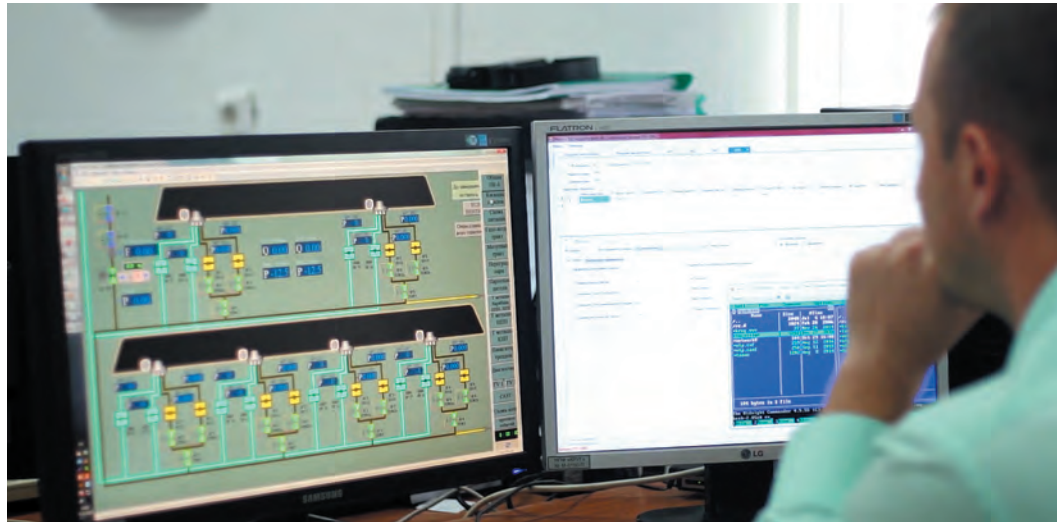
РИС. 1. ▲ Компьютерный тренажерный комплекс ТРОПА

Основой ПАК/ПТК КРУГ-2000 является SCADA КРУГ-2000, глубоко интегрированная с системой реального времени контроллеров (СРВК),