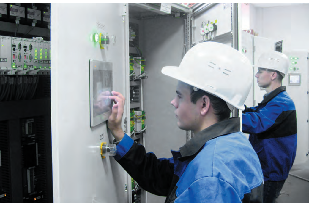
РИС. 3. ▼ Полигонные испытания АСУ ТП в «Варнице»

— Давайте поговорим о продукции уровня контроллеров. Вы предлагаете импортозамещающий промышленный контроллер DevLink-C1000 собственной разработки и ПО для контроллеров.