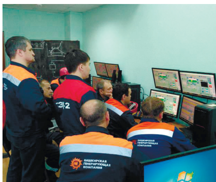
Рис. 1. Тренажер КТЦ Уфимской ТЭЦ-2

▶ иметь средства многократного воспроизведения условий заранее запланированных аварийных ситуаций,