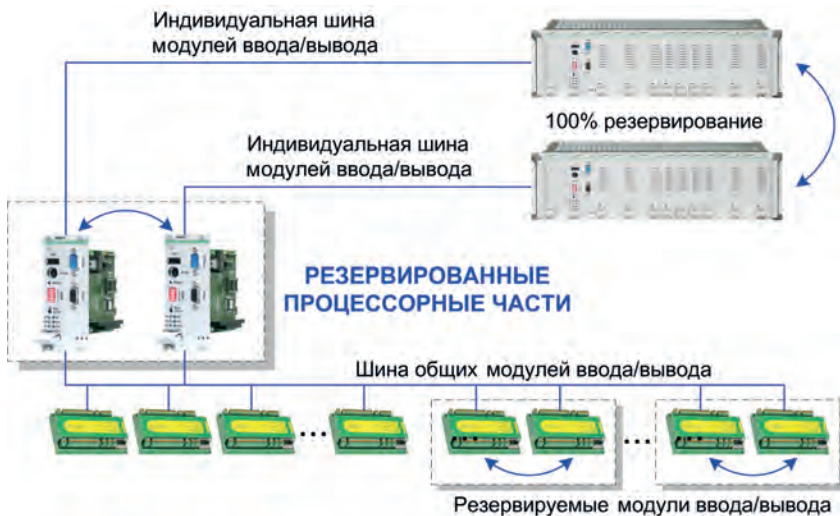
Рис. 2. Схема резервирования контроллеров