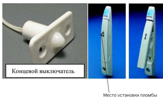
Рисунок 3 – Внешний вид датчика открытия дверцы

Дополнительная защита может быть предусмотрена путем закрепления контроллеров DevLink на DIN-рейку в корпусе шкафа, который закрывается на ключ или пломбируется. Также в шкаф может ставиться датчик открытия дверцы, информация с которого записывается в протокол событий контроллера, внешний вид датчика открытия дверцы приведен на рисунке 3.