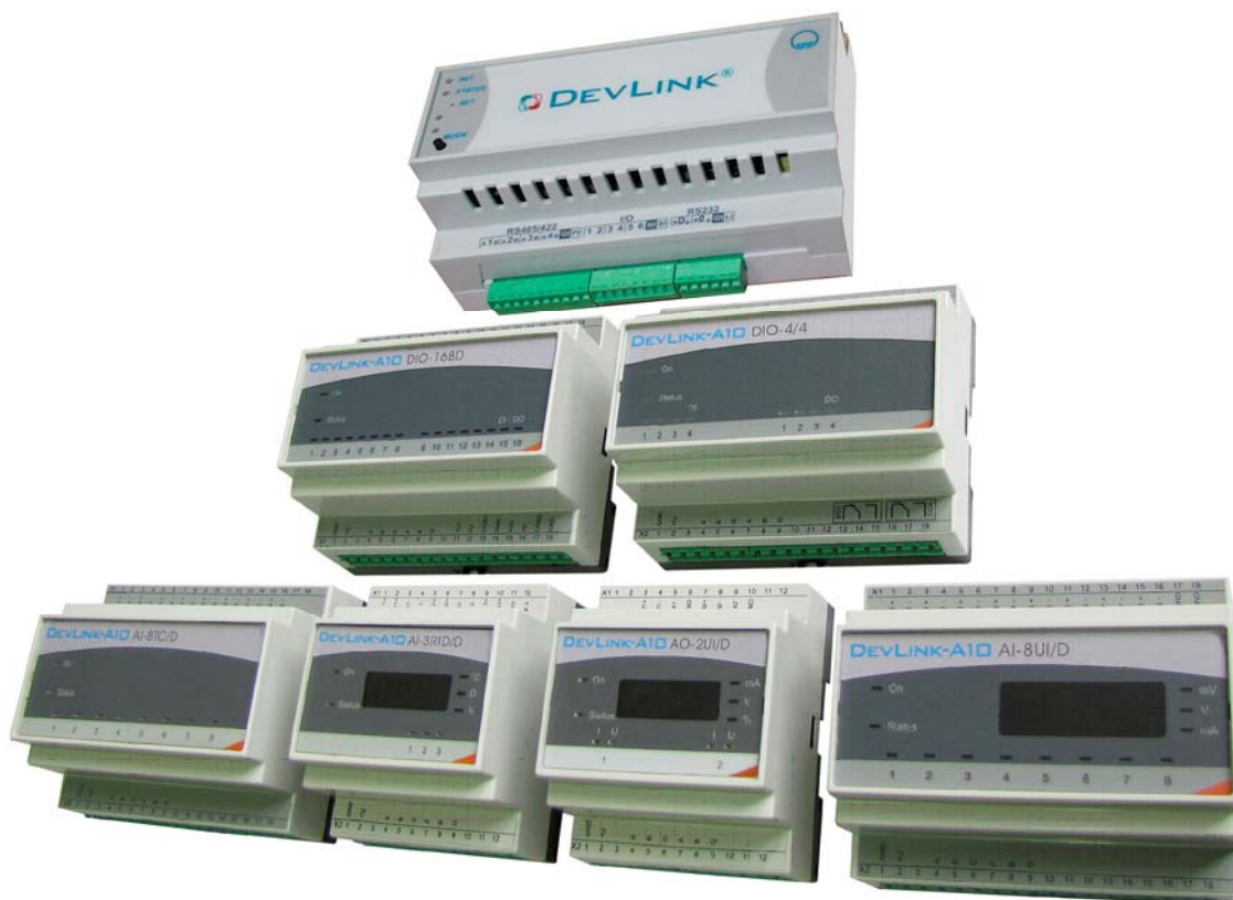
Рисунок 2 – Общий вид контроллеров DevLink

Общий вид контроллеров DevLink приведен на рисунке 2.